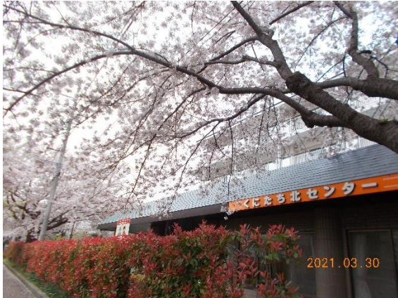
北大通りから見たセンター