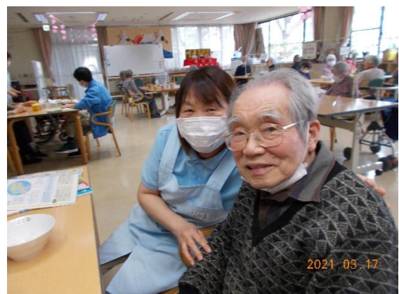
職員とのスナップ写真