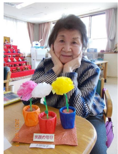
自分で作ったお花と記念写真