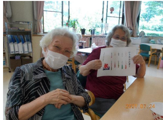
まだかしら？かき氷・・・