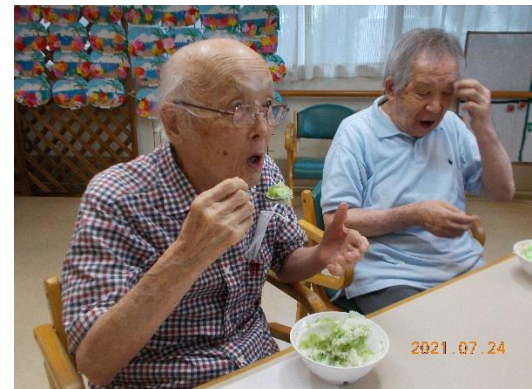
センターの夏の風物詩です