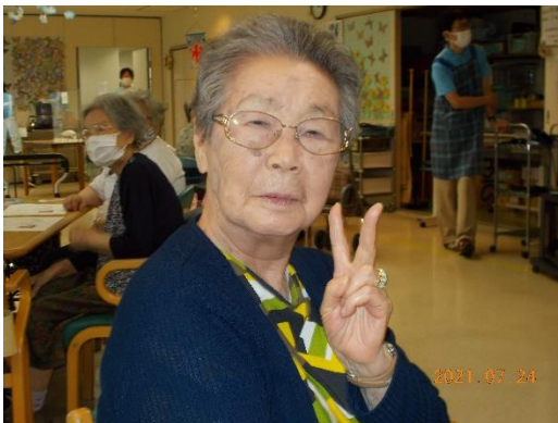
うれしいのVサインかな