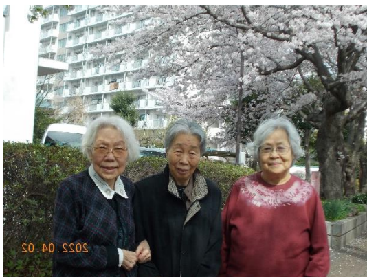
気持ちのいいお天気です 仲良し 3 人組