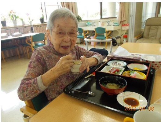
刺身美味しかった♡