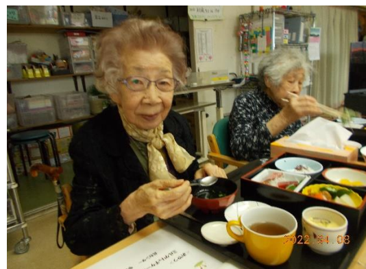
茶碗蒸しも美味しかった