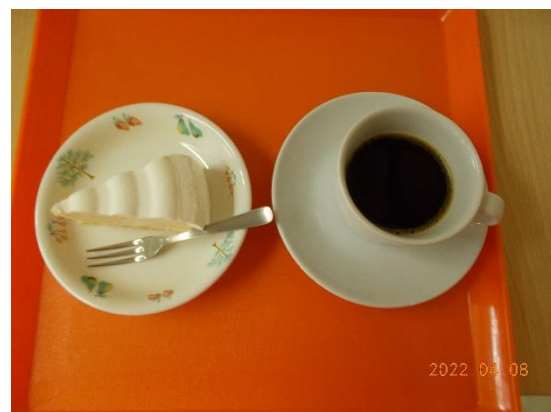
おやつはケーキとコーヒー 紅茶もあります。