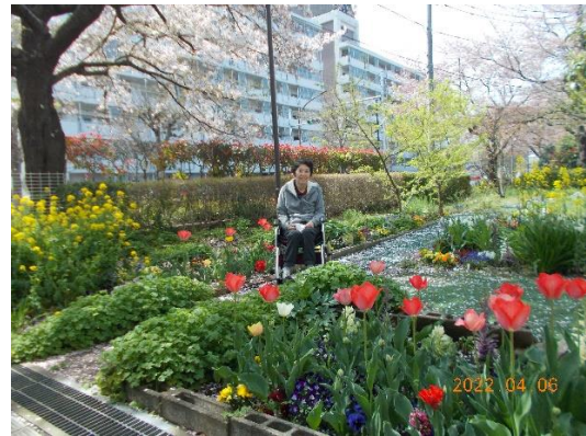
裏庭色とりどりの花