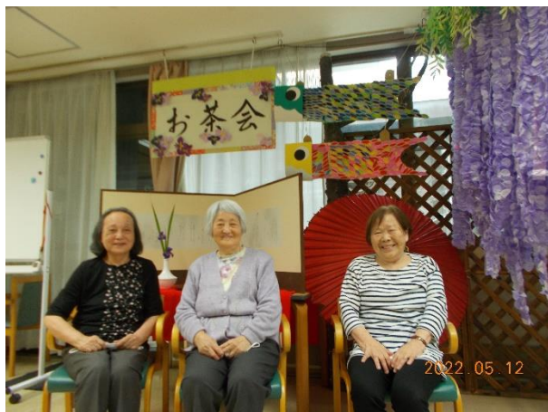
お抹茶が美味しかった!!!