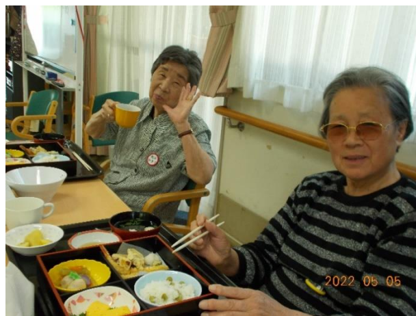
端午のランチ美味しかった