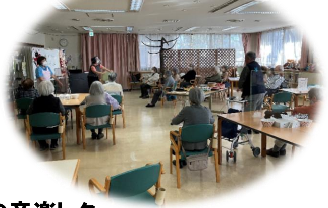
篠原先生の音楽レク