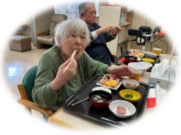
今日の食事は美味しかったです！！